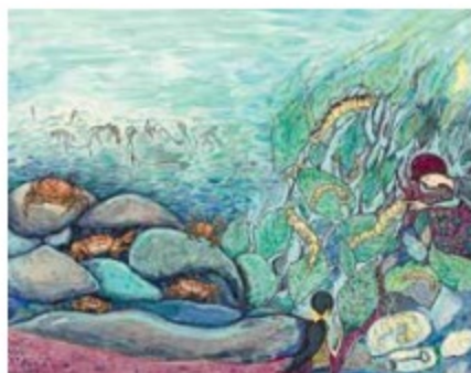
Το κείμενο του Λευκώματος έγραψε η Χρυσόθεμις Παπακωνσταντίνου και η εικονογράφηση έγινε από τη Χριστίνα Καρεκλά

Αξιοζήλευτες για τα σημερινά παιδιά, ιδίως των πόλεων, οι σκηνές κοντά στη φύση, όπως εκτυλίσσονται μέσα από τα κειμενικά και εικαστικά συμφραζόμενα. Σε διττή αναπαράσταση τα Κυθρεόπουλα στις απογευματινές παιγνιώδεις εξορμήσεις τους, μετά το σχολείο, για να κυνηγήσουν με τα καλάμια και τις αυτοσχέδιες απόχες καβούρια κάτω από τις κροκάλες του ποταμού και έξω από τις παραποτάμιες καβουρότρυπες. Αλλά και την άνοιξη να μαζεύουν φύλλα συκαμιάς, για να ταΐσουν το καματερό, που τους αντάμειβε με το πολύτιμο μετάξι. Διακριτές οι